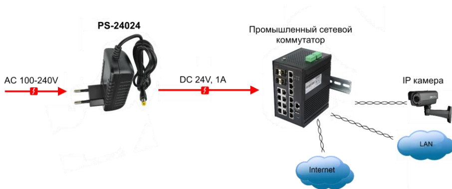
Рис.3 Типовая схема подключения блоков питания на примере PS-24024