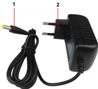
Рис. 1 Блок питания PS-24024, внешний вид, разъемы